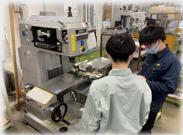
図 1:エンジン始動に向けた製作の様子

2月からすべてのパーツが製作に取り掛かっています。特にフレーム、サスペンション関係のパーツが本格的な製作を行っている状況です。また3月から本格的な製作が始まるパワートレイン班は試験的なエンジン始動に向けて必要なパーツの作成、取付を行っております。