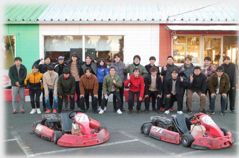
図 3:ICV,EV 比較走行会の集合写真