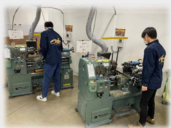
図 2:サスペンション班 パーツ製作の様子

当初はアースダウンを3月1日に予定しておりましたが、現在の製作状況遅れを鑑みて4月14日に変更となりました。それに伴い、シェイクダウンを4月28日に変更となりました。早急にアースダウン、シェイクダウンを行えるよう精進してまいります。